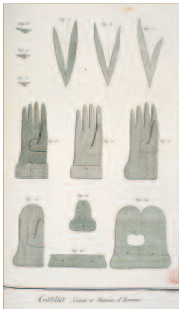
Gants, gravure de l' Encyclopédie de Diderot et d'Alembert .

La Ganterie de Saint-Junien, née sous le nom de “coopérative de Saint-Junien” reste la plus ancienne fabrique de gants encore en activité aujourd’hui. Créée le 1er mai 1919, à l’issue des mouvements sociaux du début du siècle, elle se dote en 1926 d’une mégisserie, puis, trois ans plus tard, d’une teinturerie (ces activités sont aujourd’hui arrêtées).