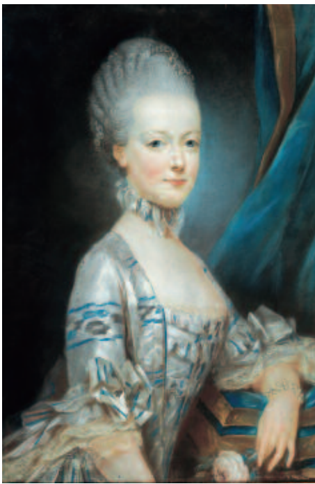
Marie-Antoinette de Lorraine-Habsbourg, alors archiduchesse d'Autriche en 1769, par Joseph Ducreux.

Jean-Louis Fargeon ne retenait qu'une chose : la future reine de France était jeune et belle et, par conséquent, l'image de la cliente idéale. Ne l'avait-on pas décrite, alors qu'elle avait quinze ans, comme "éclatante de fraîcheur, elle parut mieux que belle à tous les yeux. Sa démarche tenait à la fois du maintien imposant des princesses de sa maison et des grâces françaises ; ses yeux étaient doux, son sourire aimable" ? Il apparaissait que son mariage avec le dauphin avait fouaillé le commerce de luxe de la capitale. On racontait dans la boutique des Fargeon que la "question du fard" avait été discutée chez le ministre des Finances lui-même. L'étiquette exigeait qu'au moment des présentations à la Cour, les grandes dames fussent très abondamment fardées et, ces occasions se multipliant, de nouveaux achats furent envisagés. Un fabricant offrit cinq millions pour obtenir l'exclusivité du rouge.