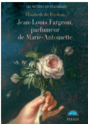
Couverture du livre Jean-Louis Fargeon, parfumeur de Marie-Antoinette . Portrait "à la rose" , par Elisabeth Louise Vigée-Le-Brun. Salon de 1783. (détail). © Château de Versailles