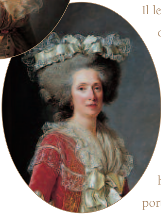
Madame Elisabeth, 1788, par Adélaïde Labille-Guiard. (détail).