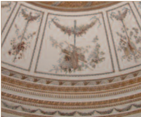
Eléments des fresques du pavillon de musique dans les jardins du Petit Trianon.