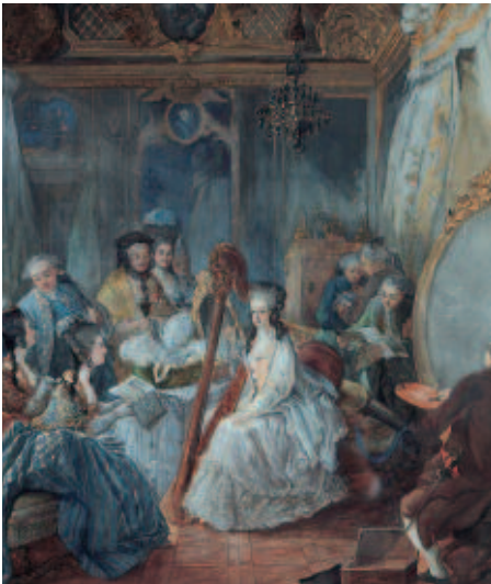
Marie-Antoinette jouant de la harpe dans sa chambre à Versailles, par Jean-Baptiste Gautier-Dagoty