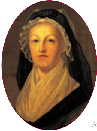
La reine Marie-Antoinette en habit de veuve à la prison de la Conciergerie, par Alexandre Kucharski.