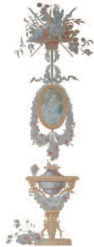
Eléments des fresques du pavillon de musique dans les jardins du Petit Trianon.