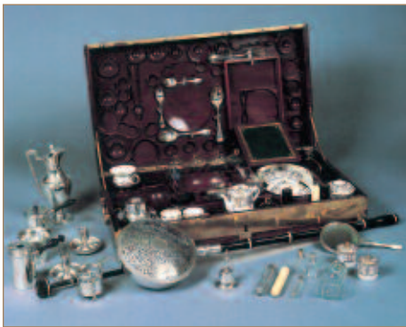
Le nécessaire de voyage dit de Marie-Antoinette , prêt du Musée international de la Parfumerie, Grasse, France. Inventaire n° 94.50

La pièce sera exposée au château de Versailles du 6 janvier au 29 mars 2005.