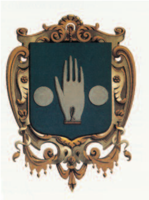
Armoiries des gantiers-parfumeurs. Extrait de l'Armorial général, tome XXIII.